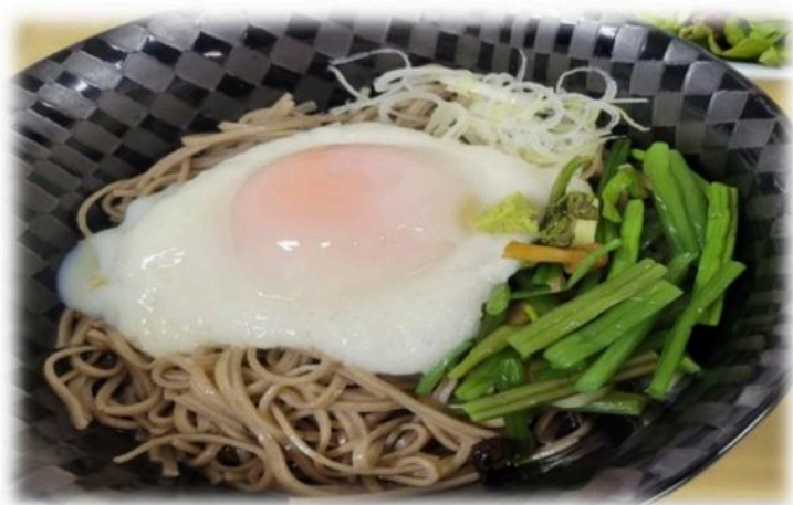
南信州産市田柿つき