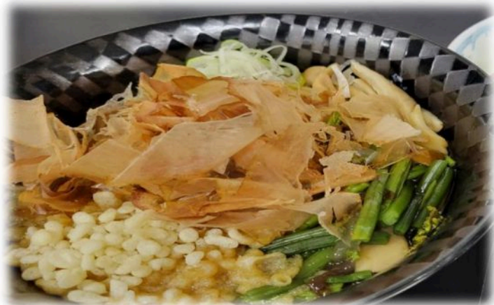
南信州産市田柿つき